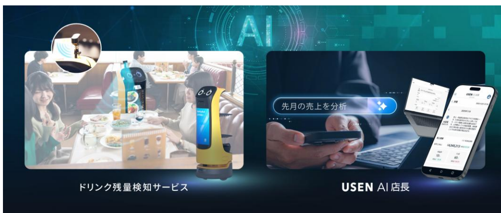
ドリンク残量検知サービス / USEN AI 店長

『ドリンク残量検知サービス』は、AIセンサーカメラが客席のドリンク残量をリアルタイムで検知・判別し、最適な「おかわりタイミング」を通知。卓上・壁面への固定設置のほか、配膳ロボット『KettyBot Pro』への搭載にも対応します。また、『USEN AI 店長』は蓄積された店舗データをもとに、飲食店経営に特化したAIが分析・アドバイスします。